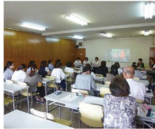
教育懇談会・研修会

障がいのある人は、何もできないと思われたり、可哀そうな人、お世話のかかる人などと思われることもあります。『障がい』への適切な支援があれば、支援を受けての自立した暮らしができます。障がい児・者の特性を社会の方々へ周知し、合理的配慮を求めなくても困っている人をお手伝いしていただける、差別や偏見のない社会の実現を第一に活動しています。