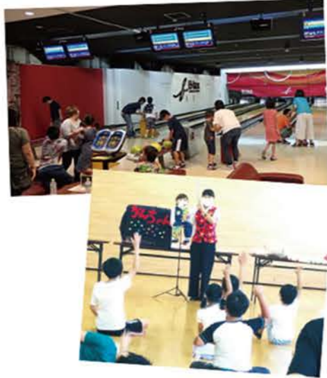
(写真上)ボウリング大会 (写真下) 療話を鑑賞

保護者に向けては、研修会、親睦行事、会報発行などを通じて福祉情報を発信し、地域社会に向けて、障がい理解・啓発活動を実施しています。